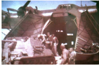
A0040-034-ME 323 (RF+XD) BEIM I