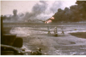
A0040-001-ANGRIFF AUF LIEGEPL.