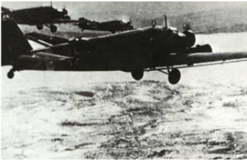
A0040-005-DER KLEINE KESSEL V.