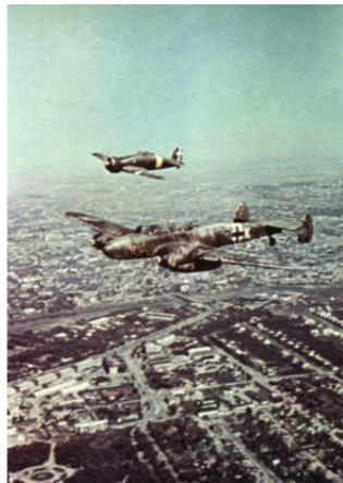
A0040-038-VOM EINSATZ AN DER