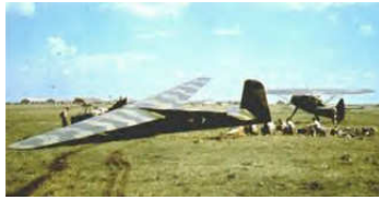
A0040-006-DFS230 UND HS 126.JPG