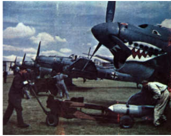
A0040-002-BELADUNG JU 87B.JPG