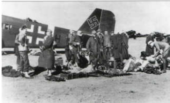
A0040-037-SOLDATEN NACH ANK