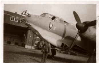
A0040-009-DO 217 N (SAMMLUNG