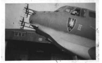
A0040-004-BUG EINER DO 217 N D