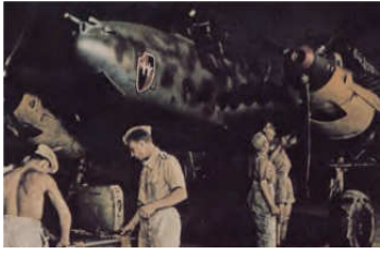
A0040-033-ME 110 DES ZG 26 BEI I