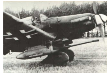
A0040-036-OBERST RUDEL HATTE