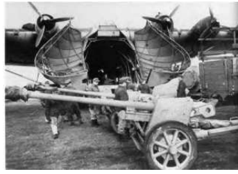
A0040-003-BELADUNG ME323 MIT