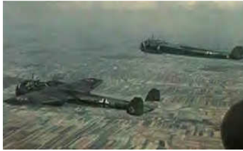
A0040-007-DO 17 ÜBER GROßBRIT