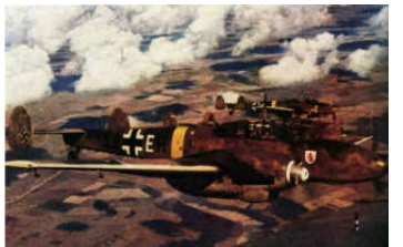
A0040-029-ME 109 UNBEKANNTE IDENTIFIZIERUNG A0040-030-ME 109 WEIÑE 10 BEI DER GRENZE A0040-031-ME 109G R-6.JPG A0040-032-ME 110 DER SKG 210.JPG