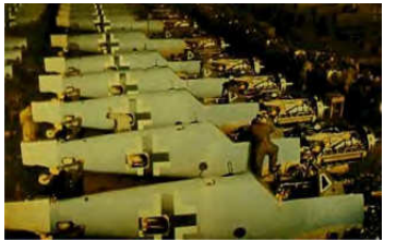
A0040-021-JU 87 B BEIM ANLASSE A0040-022-JU 87 B IM SONNENUNTERGANG A0040-023-JU 87 IM STURZ.JPG A0040-024-ME 109 - SERIENPRODUKTION