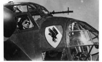
A0040-017-HE 111 BEIM BELADEN A0040-018-IM BRAND GESCHOSSE A0040-019-IN DER STEPPE ZWISCHEN A0040-020-JU88 A-4 DER I. KG 30.J