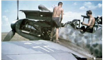
A0040-025-ME 109 DES JG 52 AN DER GRENZE A0040-026-ME 109 IN SPLITTERBOGEN A0040-027-ME 109 K ALS AMERIKANER A0040-028-ME 109 MOTORENWERKSTATT