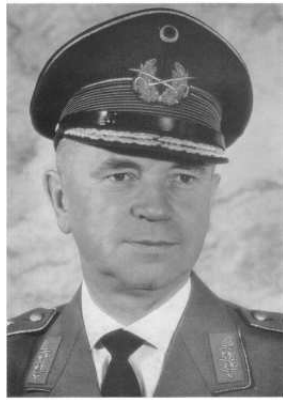
DER INSPEKTEUR DES HEERES GENERALLEUTNANT ZERBEL