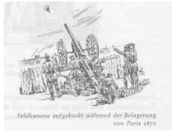
Feldkanone aufgebockt während der Belagerung von Paris 1871.