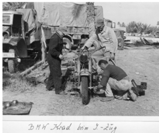
BMW Motorrad beim I-Zug