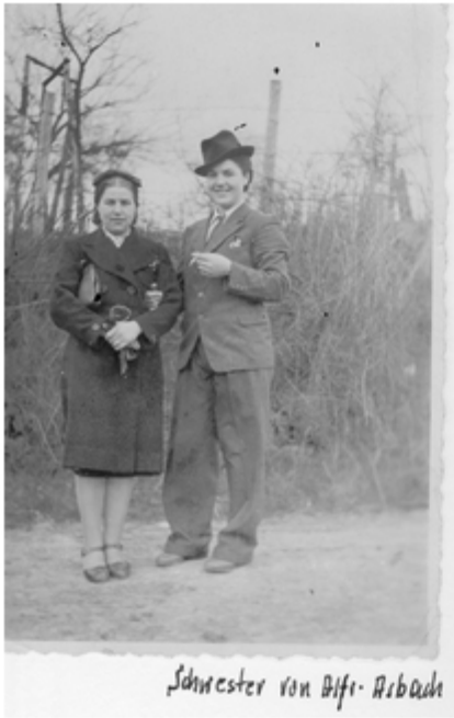
Schwester von Dflr. Ribick