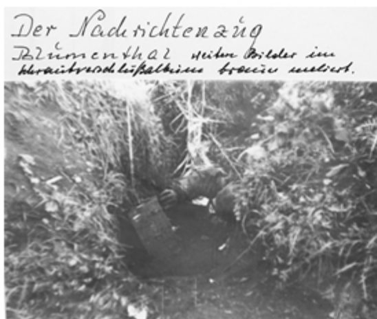
Der Nachrichtenzug Blümenthal sieht Bilder im Kameradenschaftlichen Haus