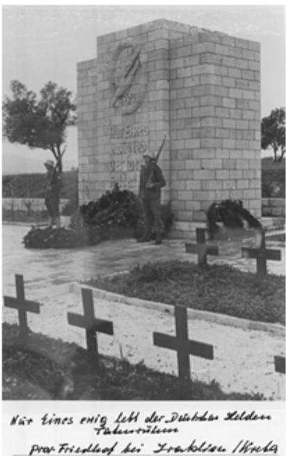
Nur eines einzig Licht der Deutschen Soldaten Todesruhestätten am Friedhof bei Frankreich 1940