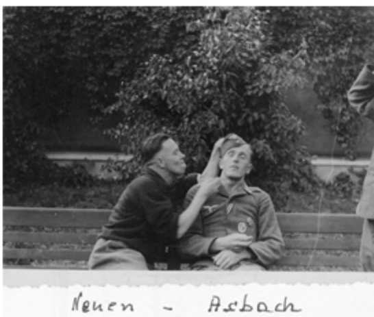
Neuen - Asbach