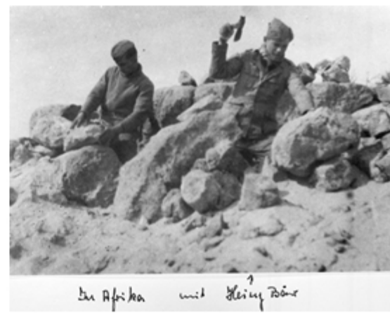
In Afrika mit Klein Wör