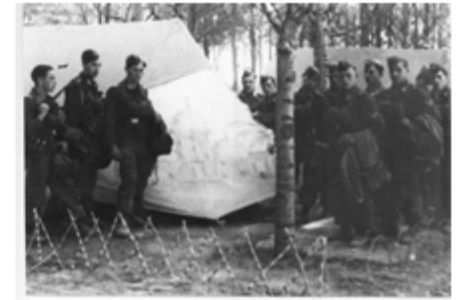
Lager Topolza Mai 1941