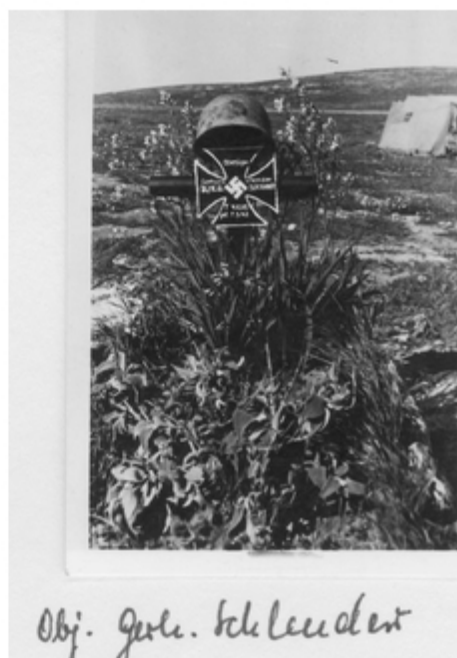
Obj. Gerh. Schlegel