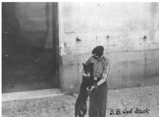
B. B. und Zack