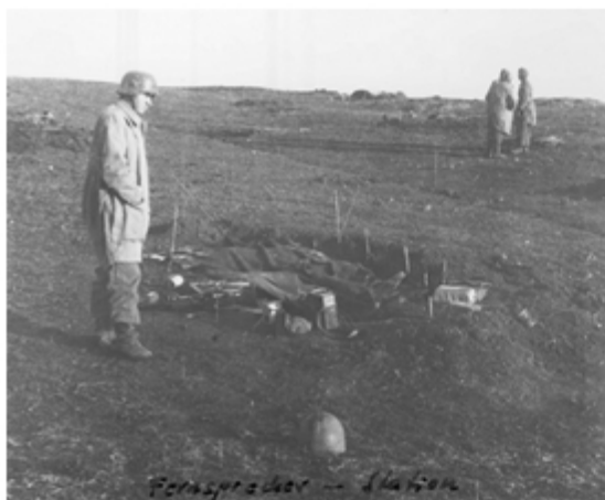
Paraspracher - Station