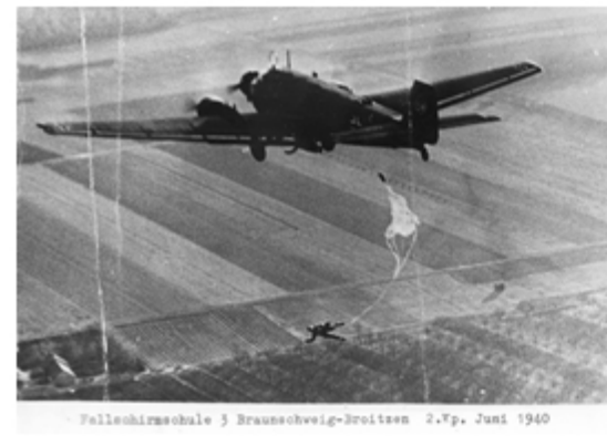
Fallschirmschule 3 Braunschweig-Broitzon 2.Fp. Juni 1940