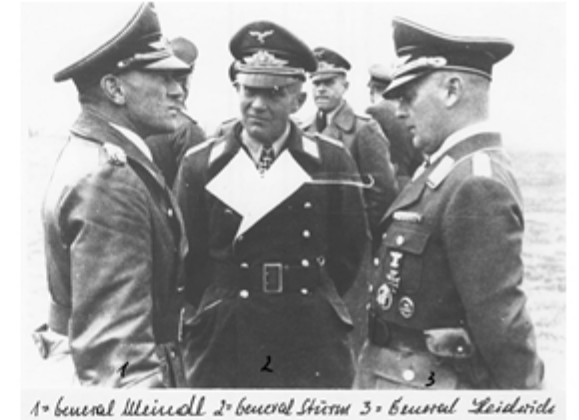
1= General Weisdel 2= General Steim 3= General Heideide