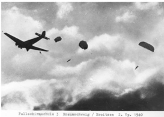
Fallschirmschule 3 Braunschweig / Broitzon 2. Fp. 1940