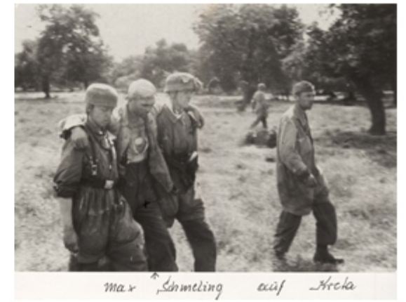
Max Schmeling auf Archa A4013-020