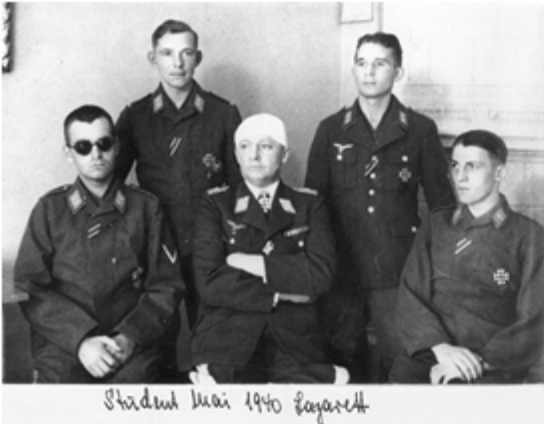
Stabschef Mai 1940 Fayard