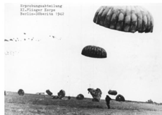
Erprobungsabteilung XI. Flieger Korps Berlin-Söbrite 1942