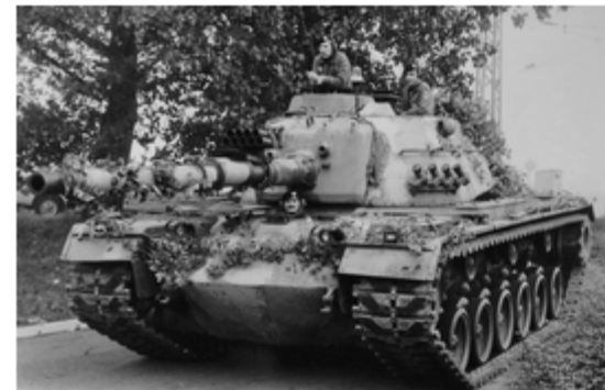
A4117-011-FrSch M 48 G PzBtl 544