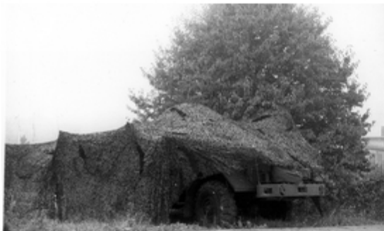
A4117-009-FrSch Lkw 5t MAN der 1. Kp unter Volltarnung 1