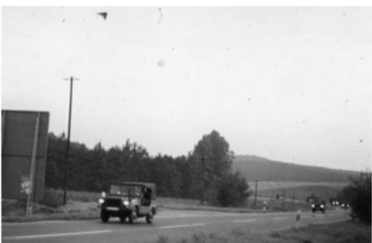
A4117-029-Jägerkompanie auf dem Marsch