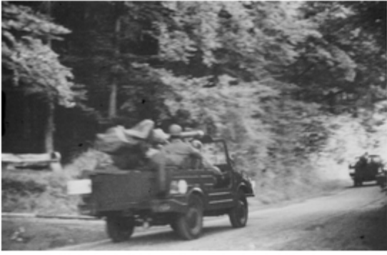
A4117-033-PzJgZug mit 106 mm Geschütz