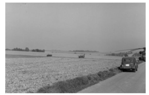
A4117-024-FschJg Btl 251 CH 53 gelandet Kraka