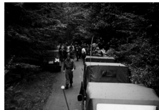
A4117-015-FrSch Tle 5 Kp Marschber Nähe MobStPkt 1