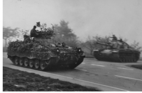
A4117-002-FR Sch Marder PzGren 362 und M48 G PzBtl