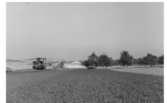
A4117-012-FrSch M48 G PzBtl 544 in Bereitstellung