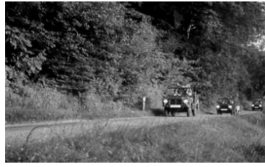
A4117-034-PzJgZug rückt vor