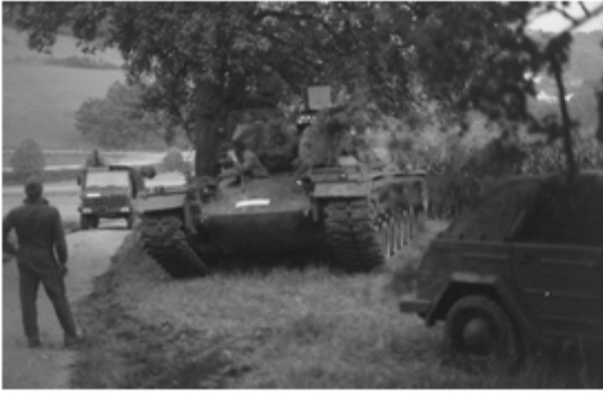
A4117-001-Fr Sch ein M 48 G des PzBtl 544 sichtet