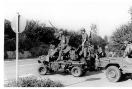
A4117-023-FschJg Btl 251 beim beziehen der Stellungeng