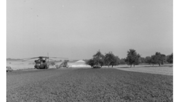
A4117-028-FschJgBtl 251 FschJg beziehen Stellungen