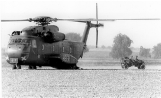
A4117-025-FschJg Btl 251 CH 53 gelandet