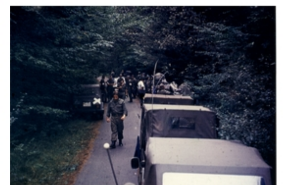
A4117-016-FrSch Tle 5 Kp Marschber Nähe MobStPkt