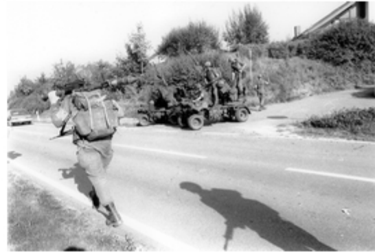
A4117-022-FschJg Btl 251 beim beziehen der Stellungen