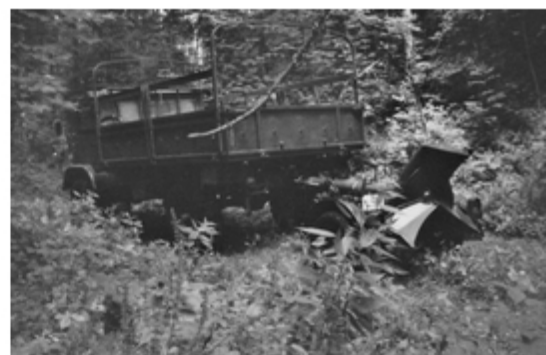
A4117-030-Lkw 1,5t mit 120mm Mörser