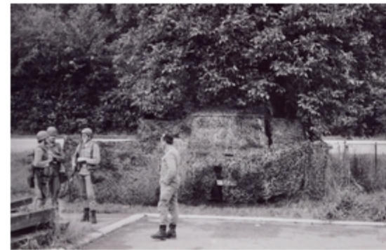
A4117-007-FrSch Grupe des JGBtl 752 im VfgRaum