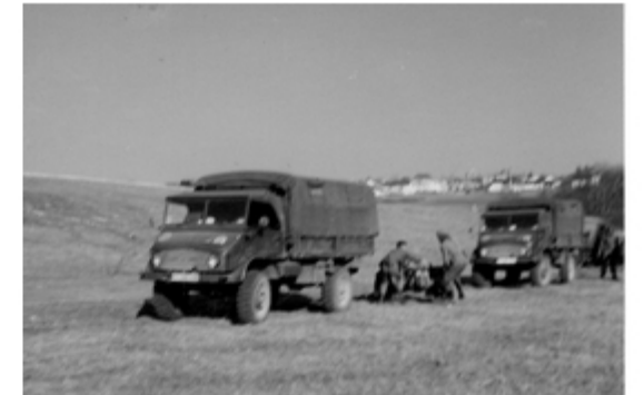
A4117-032-Mörserzug beim Abprotzen