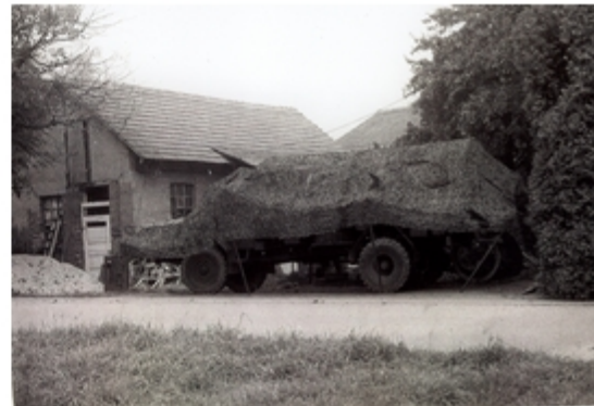
A4117-010-FrSch Lkw 5t MAN der 1. Kp unter Volltarnung