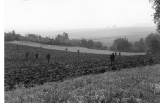
A4117-019-FschJg Btl 251 Landeplatz wird erkundet