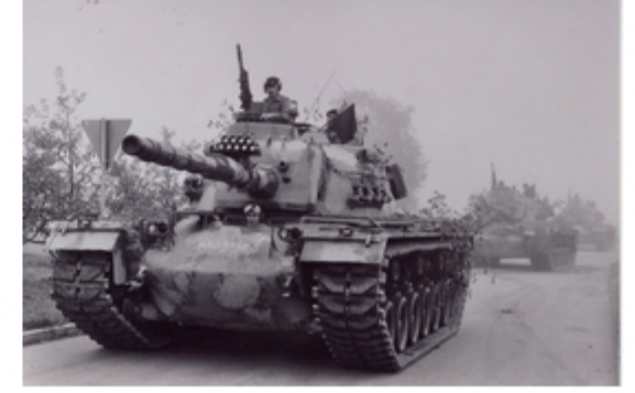
A4117-036-Zug des PzBtl 544 im Vormarsch