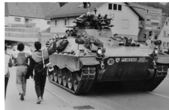
A4117-031-Marder in Mosbach