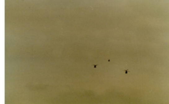
A4117-027-FschJg Btl 251 CH 53 im Anflug 2