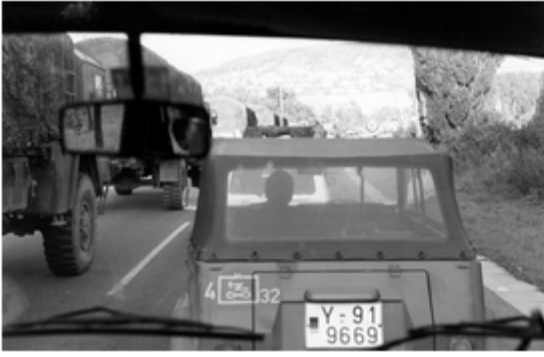
A4117-017-FrSch Übungstruppe auf dem Marsch