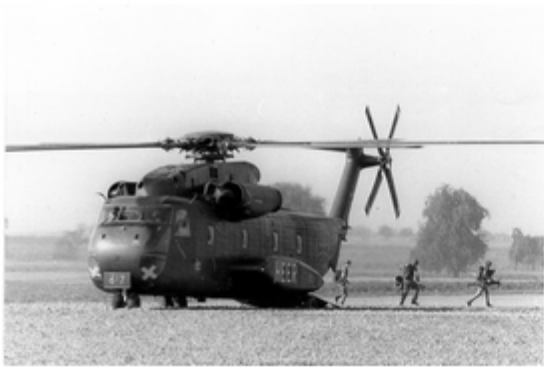
A4117-021-FschJg Btl 251 beim beziehen der Stellungen 4