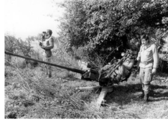
A4117-003-FrSch Fugabwergruppe des JGBtl hat