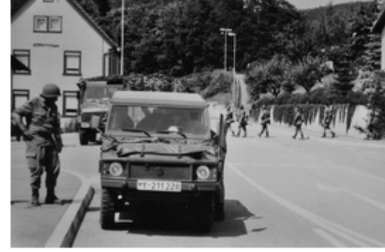
A4117-035-Tle JgBtl 752 im VfgRaum