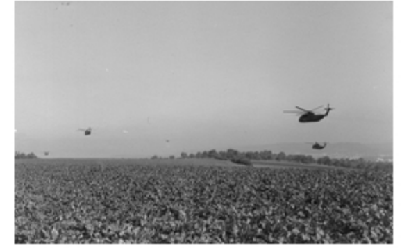
A4117-020-FschJg Btl 251 21