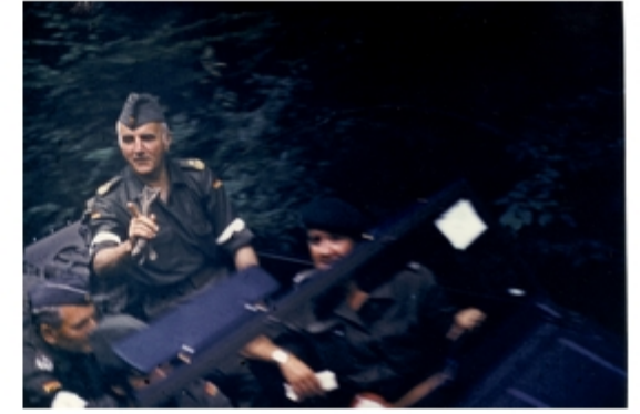
A4117-004-FrSch Gemmajor Reichenber bei 5. Kp