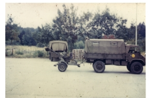
A4117-008-FrSch Lkw 1,5 t mit FlgAbwKan 20mm der 5.Kp