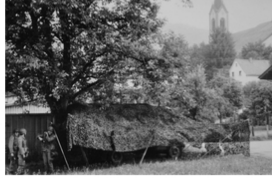
A4117-018-FRSchJägergruppe getarnt im VfGRaum