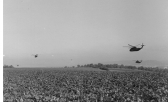
A4117-026-FschJg Btl 251 CH 53 im Anflug 1