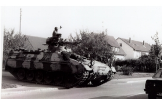
A4117-013-FrSch Marder überquert Straße